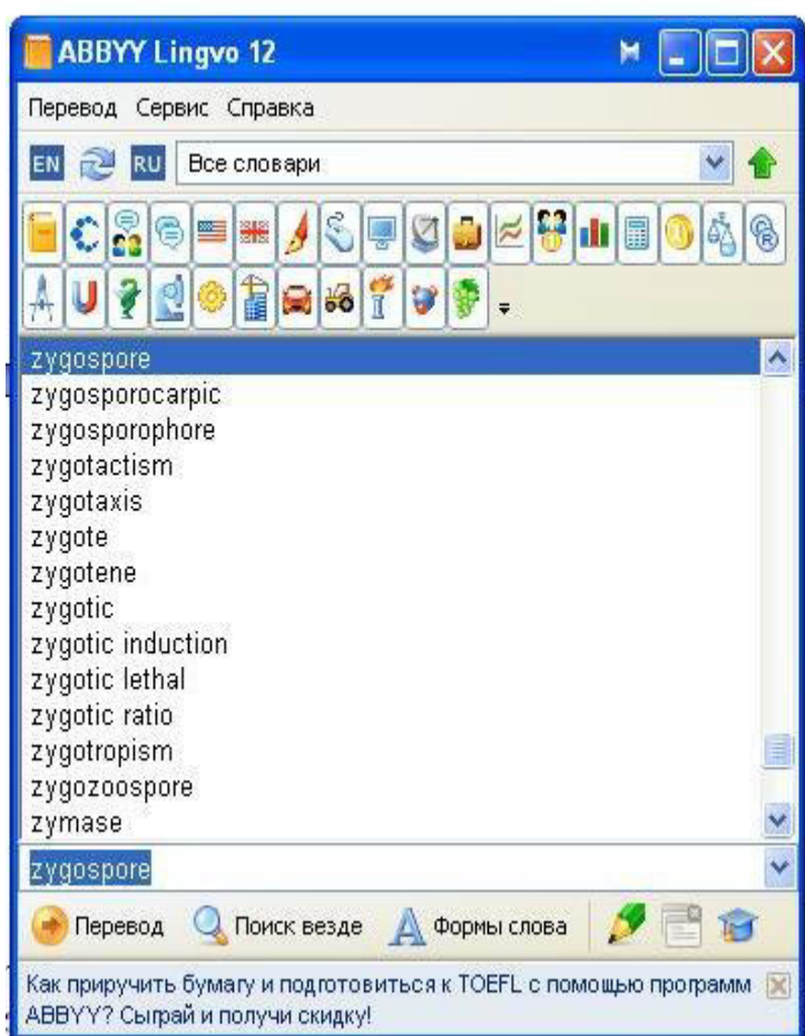
Рисунок 1. Словарная статья электронного словаря АБВУ Lingvo 12

В словарной статье электронного словаря АБВУ Lingvo 12 (рис.1) содержатся тематические подсловари, которые обеспечивают эффективный перевод определенной лексической единицы (рис.2).